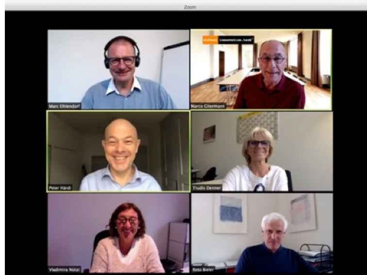
Teammeeting im innovation.tank

Am 14. April startete der neue «Zürcher» Kurs und diesmal von Anfang an virtuell. Natürlich war die Nervosität hüben und drüben gross. Wie würden die Seminare funktionieren, die Gruppenarbeiten und vor allem die Teambildung? Rückblickend lässt sich feststellen, dass Dank dem in kurzer Zeit aufgebauten Know-how seitens innovation.tank und dem grossen Engagement der Teilnehmenden das 4wöchige Seminar gut funktioniert und die Feedbacks der Teilnehmenden sehr positiv waren.